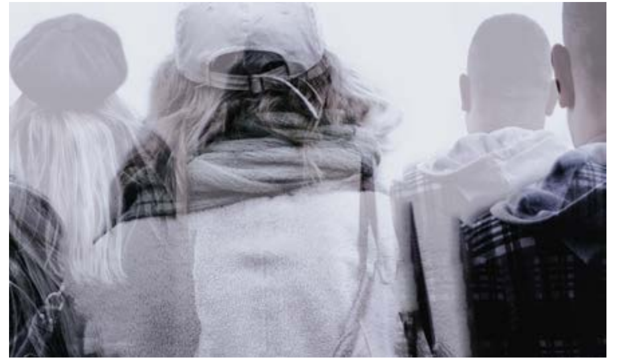
fragmenten uit: Crossing Brooklyn Ferry van Walt Whitman.

De vele honderden die met veerboten de rivier oversteken om naar huis te gaan vind ik belangrijker dan zij denken.